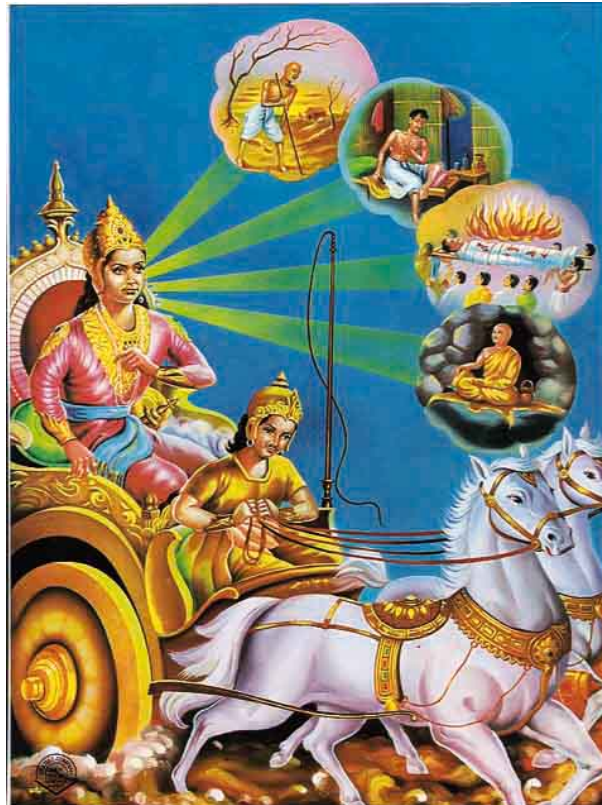
DẠO CHƠI BỐN CỬA THÀNH