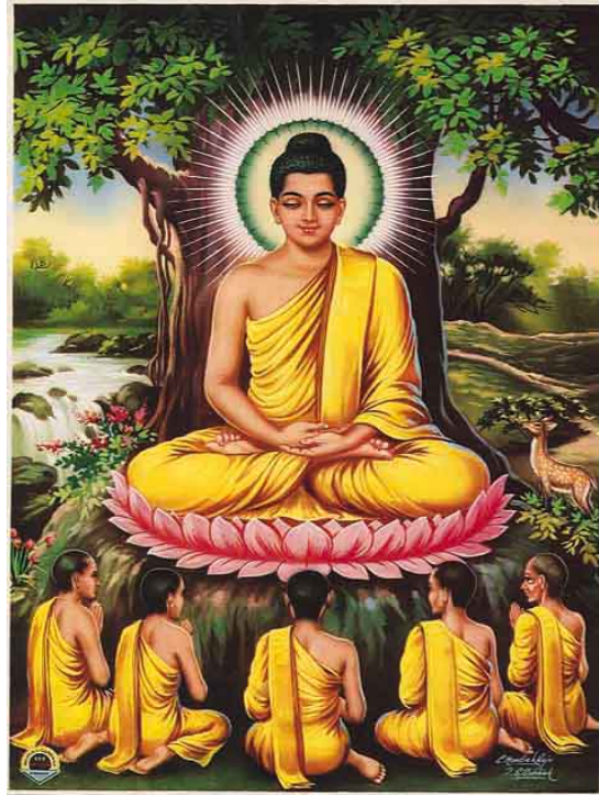
CHUYỆN PHÁP LUÂN TẠI VƯỜN LỘC GIẢ